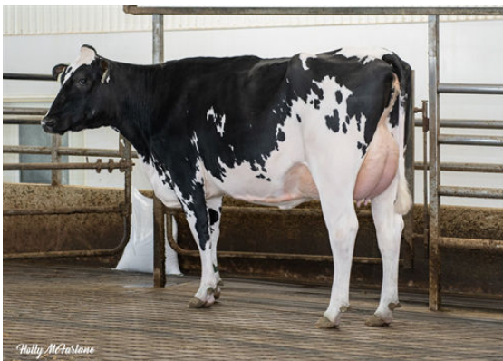
DAIRYDALE MILKTIME CHARLEY DAUGHTER